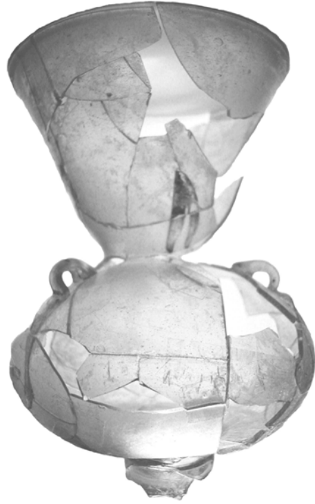
Res. 1- Askılı cami kandili