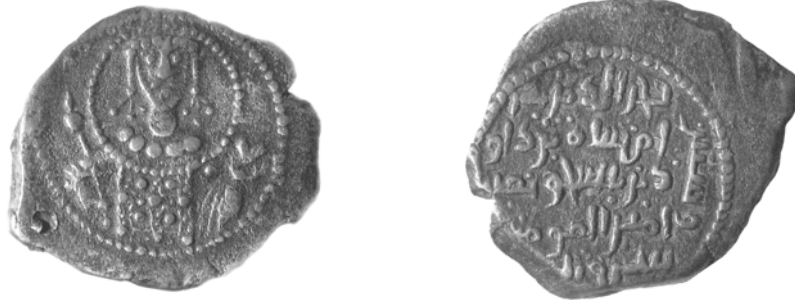
Res. 1a- 1b.