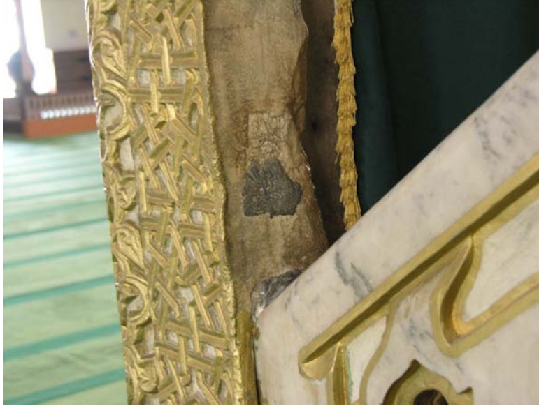
Res. 8- Balıkesir Zağanos Paşa Camisi Minberi. Kapı sövesindeki kurşun kenet izi.