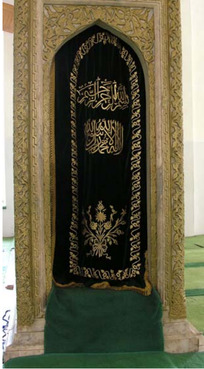
Res. 4- Balıkesir Zağanos Paşa Camisi Minberi. Kapı açıklığı