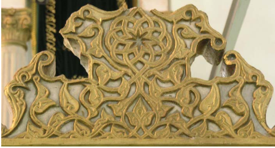
Res. 3- Balıkesir Zağanos Paşa Camisi Minberi. Tepelik.