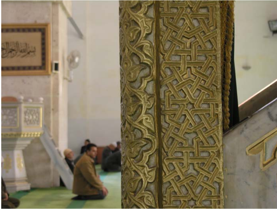
Res. 6- Balıkesir Zağanos Paşa Camisi Minberi. Köşe sütuncesi ve söve.