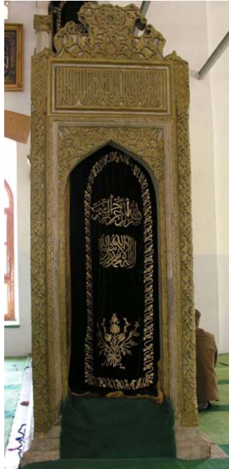
Res. 2- Balıkesir Zağanos Paşa Camisi Minberi. Kapı.