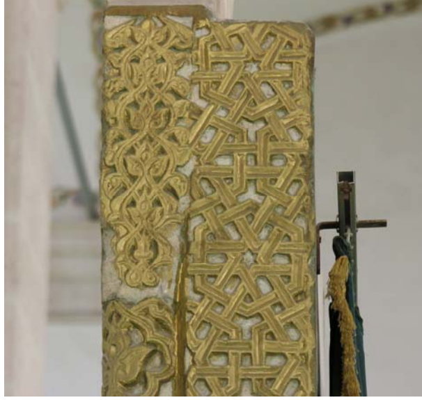
Res. 7- Balıkesir Zağanos Paşa Camisi Minberi. Köşe sütun başlığı ve sövenin bir kesimi