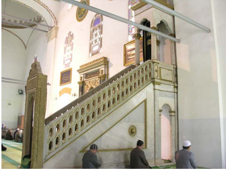
Res. 1- Balıkesir Zağanos Paşa Camisi Minberi. Batıdan genel görünüm.