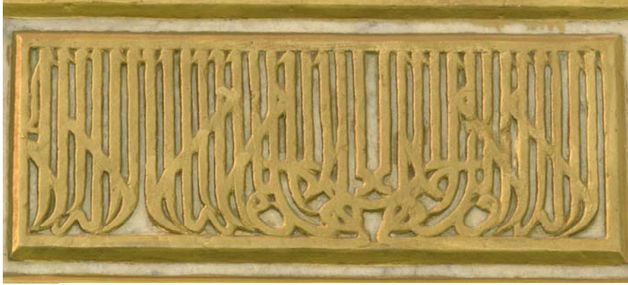
Res. 5- Balıkesir Zağanos Paşa Camisi Minberi. Aynalık kitabesi.