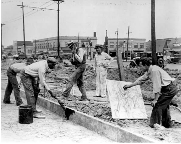
Res. 5- Michigan 'lı sanatçı Alfred Castagne, Kalkınma Yönetimi'ne bağlı olarak çalışan işçileri çalışma esnasında resimlerken, Bilinmeyen fotoğrafçı, 19 Mayıs 1939, National Archives, Records of the Work Projects Administration ( 69-AG-410 )