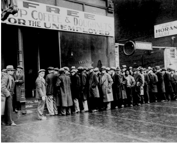
Res. 1- Chicago'da Al Capone'a ait bir aş evinin önünde bekleyen işsiz insanlar. National Archives, Records of the United States Information Agency (306-NT-165-319c)

Büyük buhran, Amerika Birleşik Devletleri'nin yaşadığı en büyük ekonomik krizdi. 1929 yılında başlayan buhran 1930'ların sonlarına gelindiğinde etkisini azaltmaya başlamıştır. 1932 yılının sonunda evsizlik en yüksek seviyesine ulaşmış, 13 milyon Amerikalı işsiz kalmış, işsiz insanlar için ücretsiz yemek dağıtılan yerler açılmıştır ( Resim 1). Krizin etkileri toplumun her tabanını görünür bir şekilde etkiler. Sanatçılar da, ekonomik koşullar nedeniyle zor günler yaşamışlar ve içinde buldukları durum yukarıda yer alan alıntı ile özetlenmiştir.