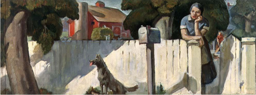
Res. 4- Mektup Beklerken , Grant Wright Christian, Hazine Destekli Sanat Projesi, 1937, Tuval üzerine yağlıboya, National Museum of American Art, Smithsonian Institution, transfer from General Services Administration

Hazine Departmanı çalışanları program başarılı olduğu için ve hala çok sayıda işsiz sanatçı bulunmasından dolayı yeni bir program başlatmak istemişlerdir. 1934 yılı