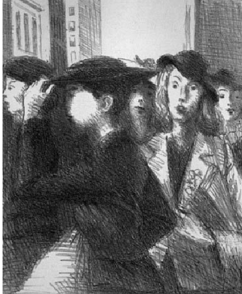
Res. 6- Eve Giden İşçi Kızlar , Raphael Soyer, New York City, Federal Sanat Projesi, Kalkınma Yönetimi, 1937, Litograf, Franklin D. Roosevelt Library, National Archives and Records Administration (MO 56-323 )