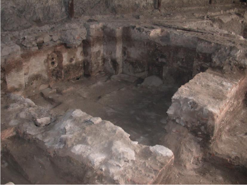
Resim 6- Manisa Saray Hamamı. Sıcaklık mekanı

sıcaklık işlevinde kullanıldığını göstermektedir. Bu bölüm yaklaşık 2,5m. genişlikte ve 20cm. yükseklikte bir sekiyle ılıklığın diğer bölümünden ayrılmıştır. Ayrıca bu bölümle ılıklığın kuzeyde kalan bölümü arasında, doğu ve batı duvarları üzerinde yer alan karşılıklı duvar çıkıntılarının kemer ayağı olarak kullanıldığı; dolayısıyla iki bölümün farklı örtülere sahip oldukları anlaşılmaktadır. Ilıklığın kuzey bölümünde de yaklaşık 20cm. yükseklikte ve 80 cm. genişlikte bir seki vardır. Seki, 30cm. genişlikle batı duvarında da devam etmekte ve ılıklığın güneyindeki sekiye bağlanmaktadır. Mekanın zemin döşemesi büyük ölçüde sökülüştür. Ancak kuzeybatı ve güneybatı köşelerde kalan parçalardan, zeminin mermer levhalarla kaplı olduğu saptanabilmektedir. Kuzeybatı köşedeki geometrik süsleme içeren parça, Bizans dönemine aittir. Bu bulgudan hareketle yapının zemin döşemesinde devşirme malzemelere de yer verildiği anlaşılmaktadır.