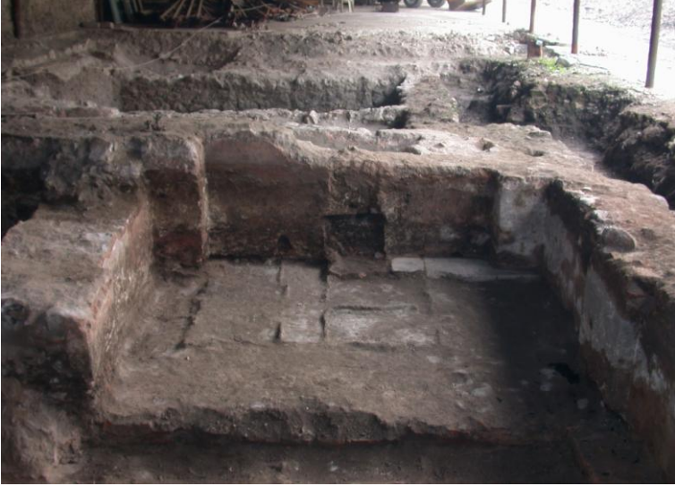
Resim 5- Manisa Saray Hamamı. Ilıklık mekanı.

Aralık mekanının batısındaki açıklıktan hamamın ılıklık mekanına geçilmektedir (Resim 4, 5). Ilıklık mekanı 6.20x3.20m boyutlarındadır ve iki bölümden oluşmaktadır. Ilıklığın güneyinde kalan bölümdeki kurna izleri, bu kısmın adeta bir