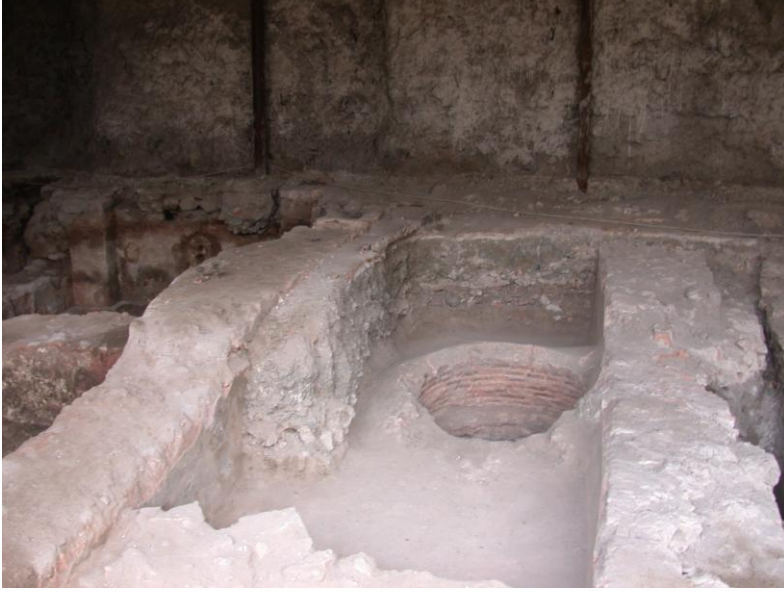
Resim 7- Manisa Saray Hamamı. Su deposu.

Ilıklık ve halvet mekanlarının güney duvarı boyunca, doğu-batı doğrultusunda uzanan ve ortasında bir kazan yuvası içeren su deposunun örtüsü günümüze ulaşmamıştır (Resim 7). Ancak, döneminin karakteristiği olarak sivri kemerli bir tonozla örtülü olduğunu kabul etmek mümkündür.