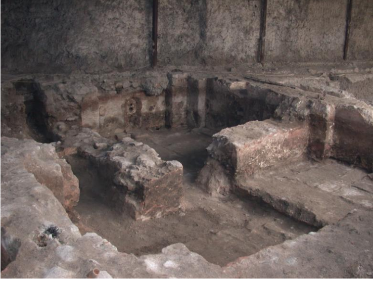
Resim 4- Manisa Saray Hamamı. Ilıklık ve sıcaklığın kuzeybatıdan genel görünüşü.