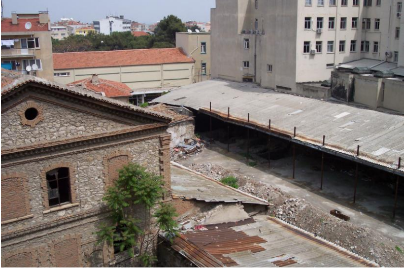
Resim 1- Manisa Saray Hamamı. Kazı alanının güneybatıdan genel görünüşü.