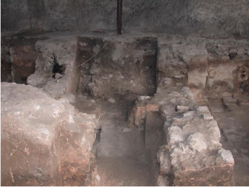
Resim 3- Manisa Saray Hamamı. Aralık ve tuvalet-tıraşlık mekanları.

Soyunmalık mekanının güney duvarı üzerinde yer alan, sonradan kapatılmış giriş açıklığından, 2m.x1.60m. boyutlarında küçük bir mekana ulaşılmaktadır. Güney duvarı üzerinde bir seki içeren bu küçük mekan, aralık mekanı olmalıdır. Bu mekanın doğusunda yer alan açıklıktan, olasılıkla hamamın tuvalet ve traşlık mekanlarına ulaşılyordu. Ancak bu mekanlar kısmen doğudaki 32. parsel içinde kaldıkları için planları tam olarak ortaya çıkartılamamıştır (Resim 3).