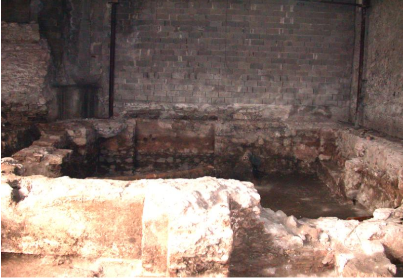
Resim 2- Manisa Saray Hamamı. Soyunmalık mekanı.

Hamam, kuzey-güney doğrultuda uzanmaktadır. İnşa malzemesi moloz taştır. Soyunmalık mekanı kuzeydedir (Resim 2). Duvarlarının ortalama 1.90m. yükseklikteki kısmı ayakta kalabilmiş olan mekan, 8x7,5m. boyutlarındadır. Kuzey duvarının üzerine